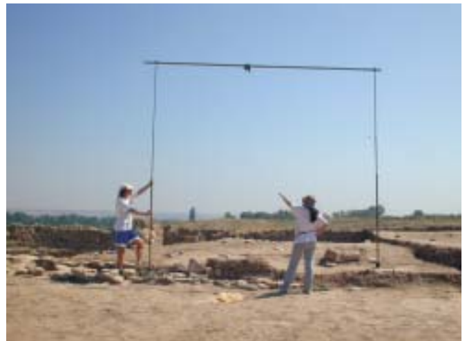
Fig. 5. Toma de pares estereoscópicos

También se han diseñado, construido y depurado prototipos de elementos auxiliares para la toma fotográfica de pares estereoscópicos constituyendo una auténtica aportación instrumental a este tipo de trabajos, ya que suponen una mejora en el rendimiento, disposición y posibilidad de control de la toma fotográfica (Fig. 5). (VALLE MELÓN, LOPETEGUI GALARRAGA, 2001).