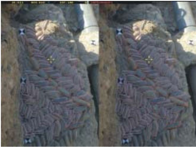
Fig. 1. Restitución fotogramétrica