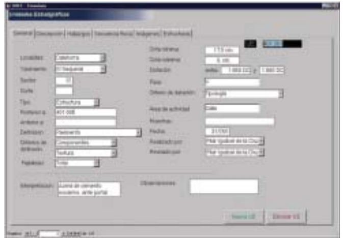
Fig. 2. Entrada de información en la base de datos

coordenadas de puntos que definen los objetos no fotografiados) se procede, mediante el consiguiente trabajo de gabinete, a la obtención de los documentos que formarán parte de la base de datos geométrica de cada uno de los yacimientos. En esta base de datos geométrica aparecerán representadas las unidades estratigráficas de forma que puedan ser utilizadas para el análisis arqueológico del yacimiento y constará de diversos tipos de representaciones: plantas, alzados, desarrollos, secciones... (Fig. 3).