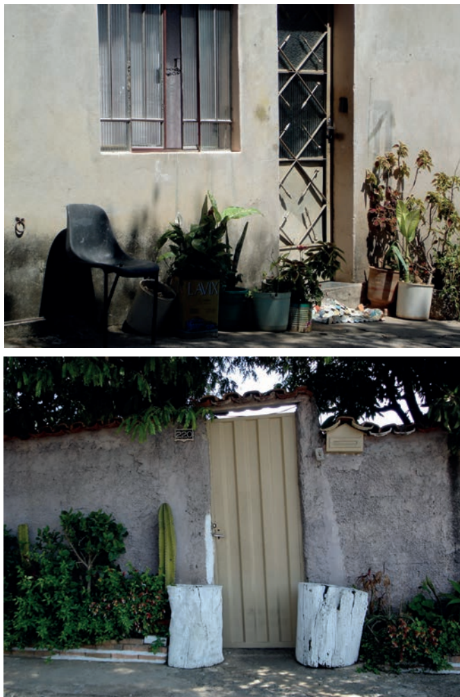
Figura 4. Vista de muros perimetrales de casas de grupos proletarios en los que se observan “pequeños apéndices de sociabilidad”.

género, edad, etc.). Es en este contexto que los muros paredes refuerzan las categorías ellas-ellos/nosotras-nosotros. Al mismo tiempo, estos “cuerpos congelados”, distribuidos por todas partes, terminan dando la espalda a las personas que no tienen, las transforman en “otras personas”, volviéndolas invisibles.