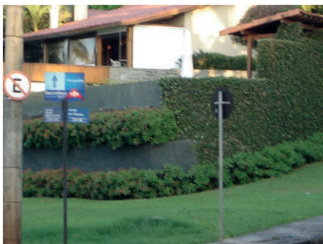
Figura 2. Vista de muros perimetrales que naturalizan su propia existencia.

A diferencia de las clases altas, los sectores populares del barrio, también tuvieron un aumento en el tamaño de sus muros perimetrales a través del tiempo. Sin embargo, difícilmente estos ultrapasen los 2 metros, a pesar de que esta altura es suficiente para no permitir