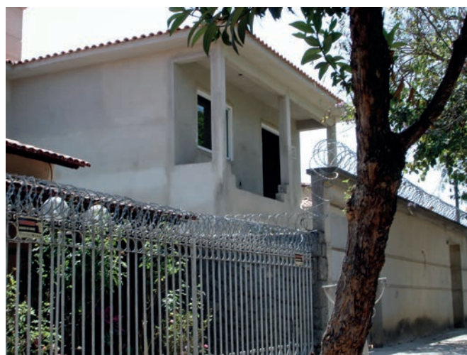
Figura 3. Vista de muros perimetrales que exhiben discursos de violencia.

el contacto con los de fuera. Como para estos grupos la interacción social directa es importante en su cotidianidad, han generado lo que llamamos “pequeños apéndices de sociabilidad” (Zarankin 2010). Esto es, instalar bancos de material, o troncos o sillas viejas en las puertas de las casas (muchas veces hasta con macetas y otros adornos), donde suelen instalarse cuando vuelven de trabajar a fin de tarde o durante la mayor parte del fin de semana, para poder interactuar con las demás personas (Fig. 4).