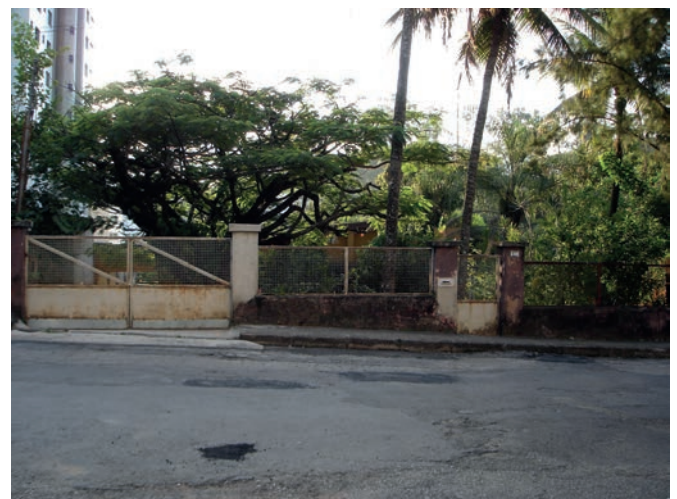
Figura 1. Vista de muro perimetral de una casa de la década de 1960. Fotografía Zarankin 2006.

Los resultados obtenidos muestran que las casas más antiguas, de 1950 y 1960, pertenecientes a familias acomodadas de la sociedad Belohorizontina, eran construidas con muros perimetrales bajos 0,80 a 1,20 m de altura, lo que permitía la interacción entre los habitantes de la residencia y los vecinos o transeúntes (Fig. 1). Una lectura de estos parámetros permite observar que el muro actúa apenas como un límite simbólico para delimitar lo privado de lo público. Al mismo tiempo, quienes residen en la casa ven a las demás personas como iguales. En otras palabras, estamos ante un cuerpo que hace frente a la interacción con las otras personas.